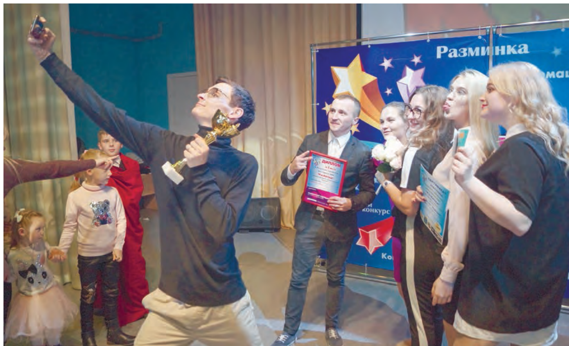
Победители среди взрослых — команда «Педсовет»