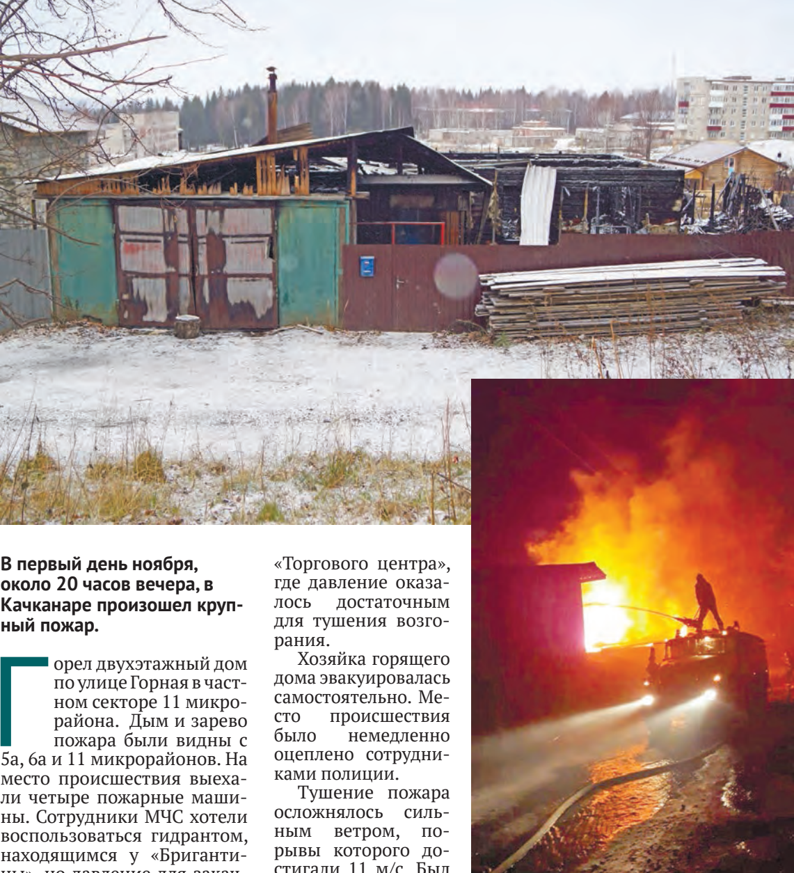
В первый день ноября, около 20 часов вечера, в Качканаре произошел крупный пожар.

Горел двухэтажный дом по улице Горная в частном секторе 11 микрорайона. Дым и зарево пожара были видны с 5а, 6а и 11 микрорайонов. На место происшествия выехали четыре пожарные машины. Сотрудники МЧС хотели воспользоваться гидрантом, находящимся у «Бригантины», но давление для закачки воды оказалось слабым. Сотрудники полиции приняли решение перекрыть дорогу и протянуть рукава от