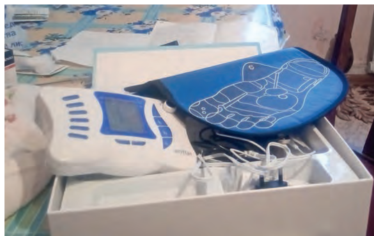
Прибор «Фотон» имеет много противопоказаний