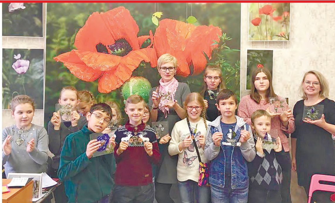
Работы в технике «витраж» получились у всех!