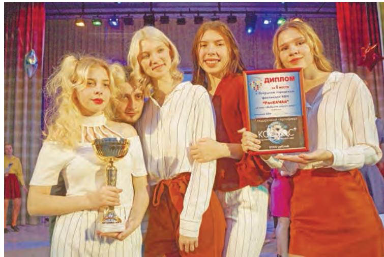
Команда «Ближе к делу» — победители среди школьников