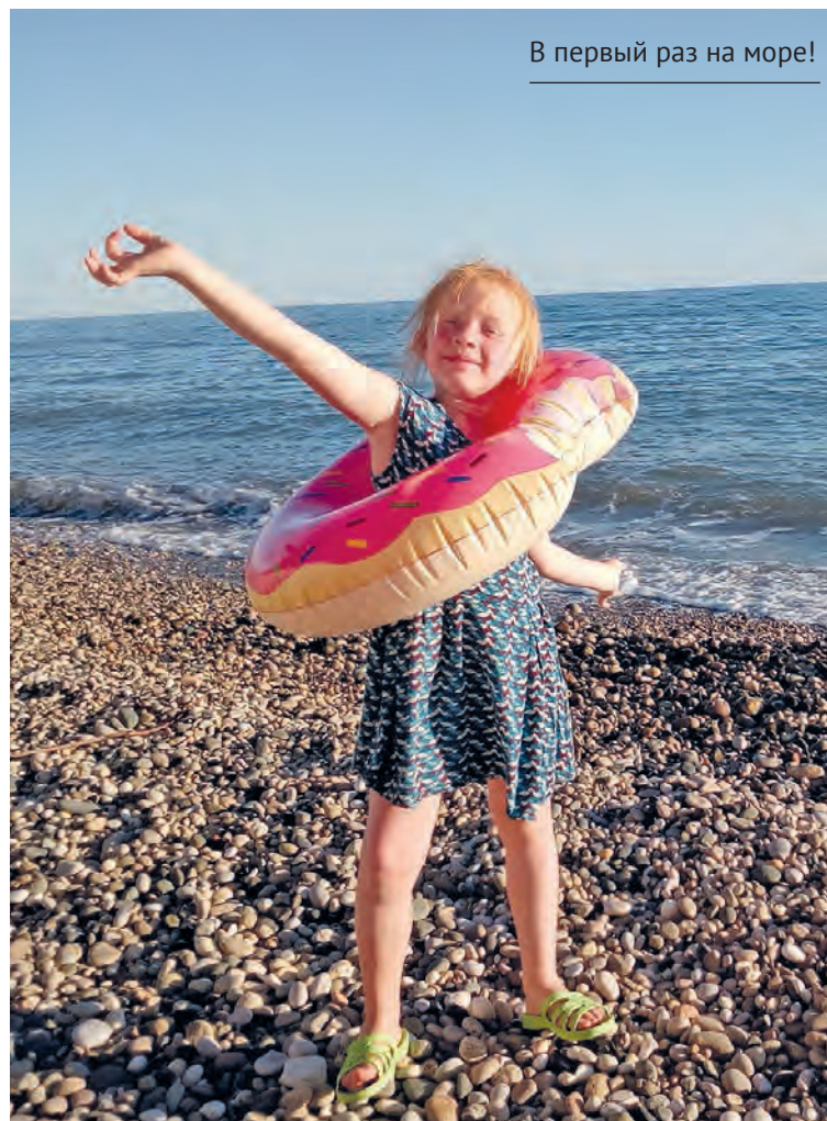
В первый раз на море!

огромными кипарисами и эвкалиптами и с белым лепным забором. Видно, что набережная требует ремонта. На территории находится крытая палатка с сероводородными ваннами, работает массажист. Но и набережная, и массажная палатка, и места территории отеля кажутся не очень ухоженными. Такое ощущение, что, как всё осталось с советских времен, так и стоит.