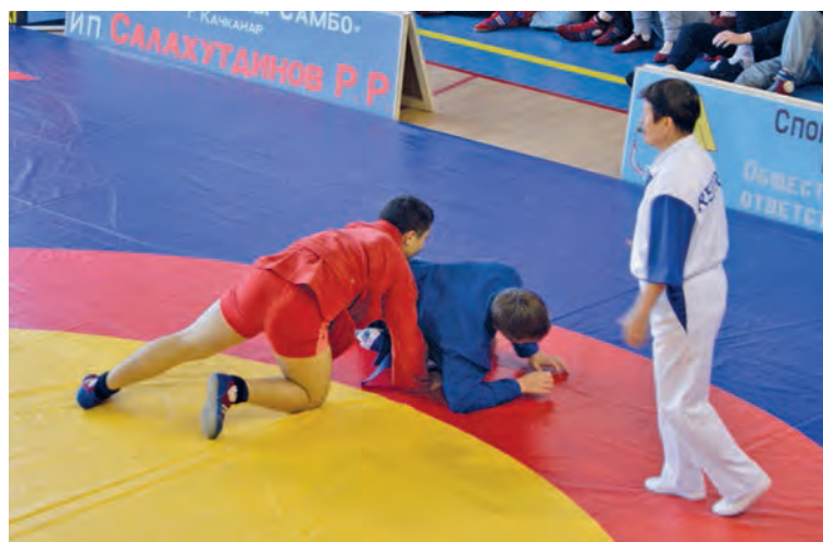
Выйти на татами и доказать, что ты лучший

3 ноября в качканарском Дворце спорта состоялся IX межрегиональный турнир по самбо на Кубок Евразы, посвященный 80-летию основания самбо в России.