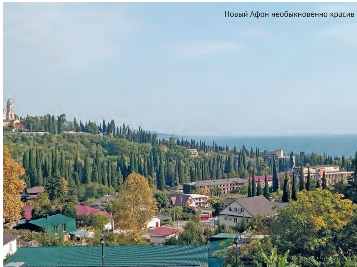
Новый Афон необыкновенно красив

Пишу подробно для того, чтобы вы, если соберётесь