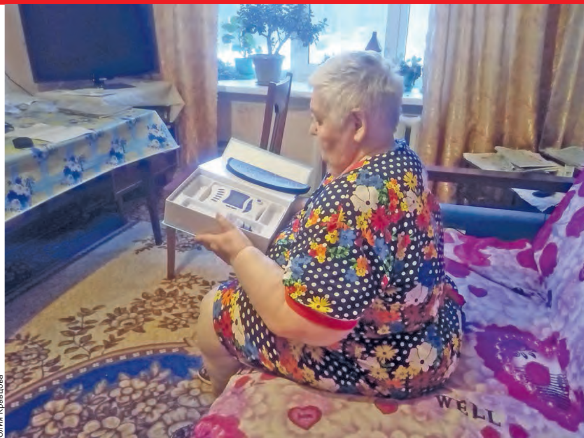
«Зачем же я это купила?»

Мужчина попросил удостоверение ветерана труда, записал данные хозяйки