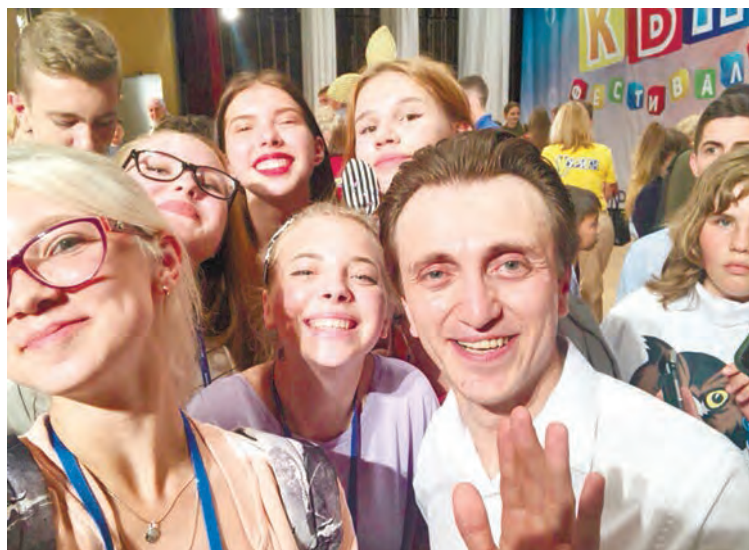
Наши ребята с Денисом Дороховым, КВНщиком и участником шоу «Однажды в России» на ТНТ

Ты приносишь редактору на следующий день новое выступление, а он смотрит на новый материал и оставляет от него еще две шуточки и песню, советует дописать пару миниатюр и коду, а выступление на втором туре уже завтра. И опять