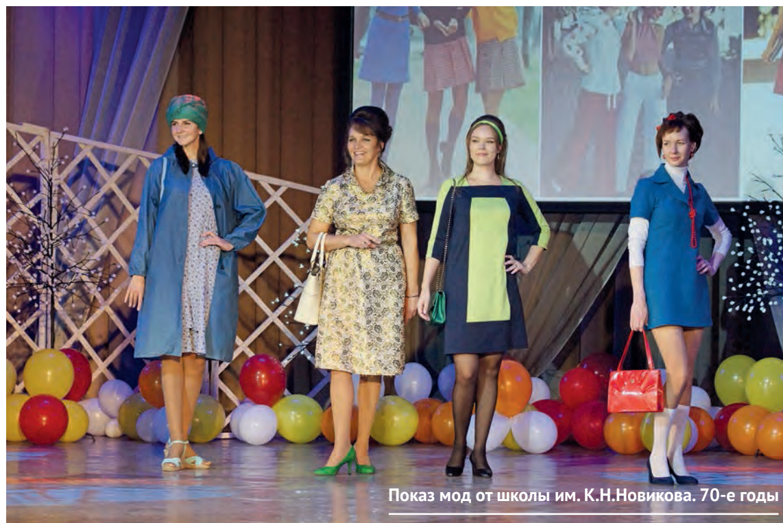
Показ мод от школы им. К.Н.Новикова. 70-е годы