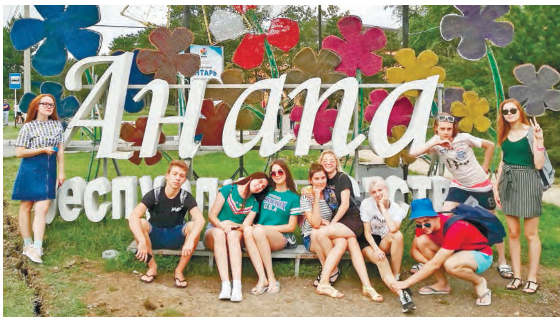
Команда КВН из Качканара «Ближе к делу»