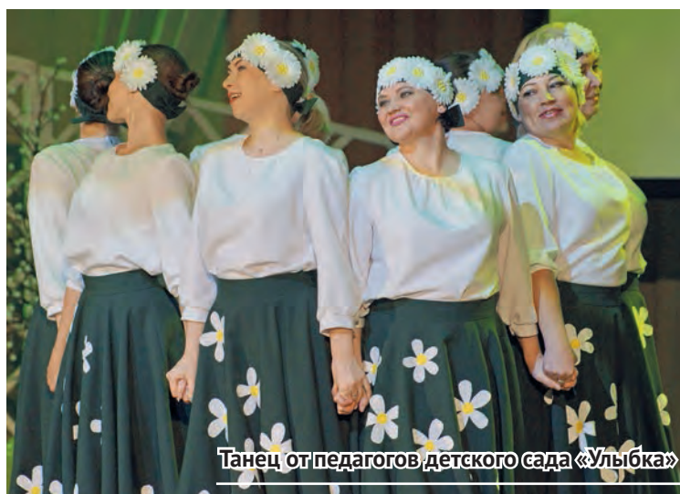
Танец от педагогов детского сада «Улыбка»

Подробный фотоотчет с Дня учителя есть в редакции «Нового Качканара». Желающие получить своё фото для личного архива могут подойти в редакцию с флэшкой.