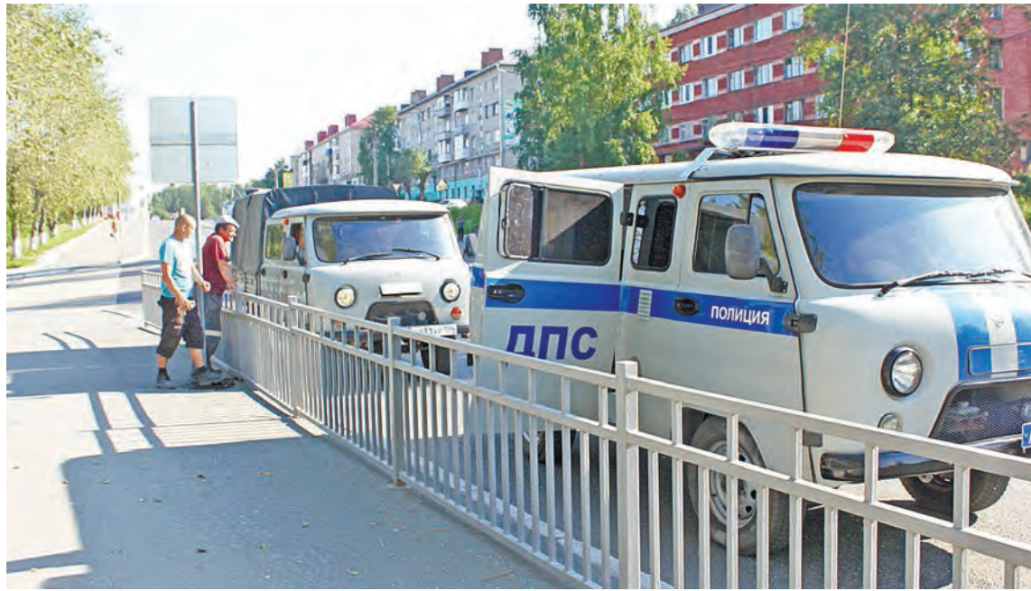
Работники РСУ: «Эту засаду мы знаем, но... как говорят — не спеши, а то успеешь»

— Ну, вот посмотрите как-нибудь сами, до пешехода еще более 20 метров, а я обязан остановиться,