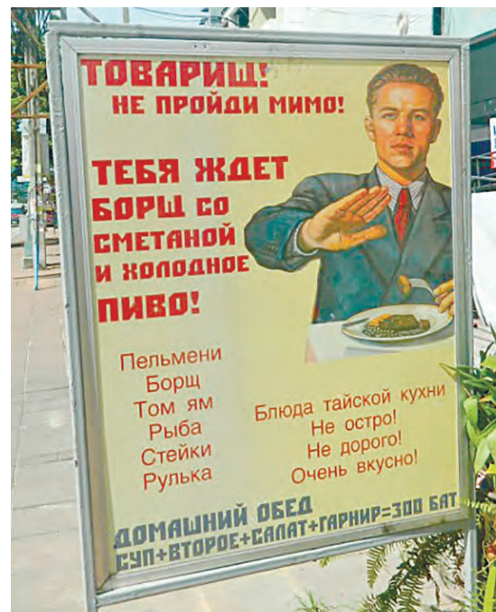
Даже в Азии можно найти привычную для русского человека еду

Завтрак в отеле стандартный. Сосиски, тосты, яичница, фрукты