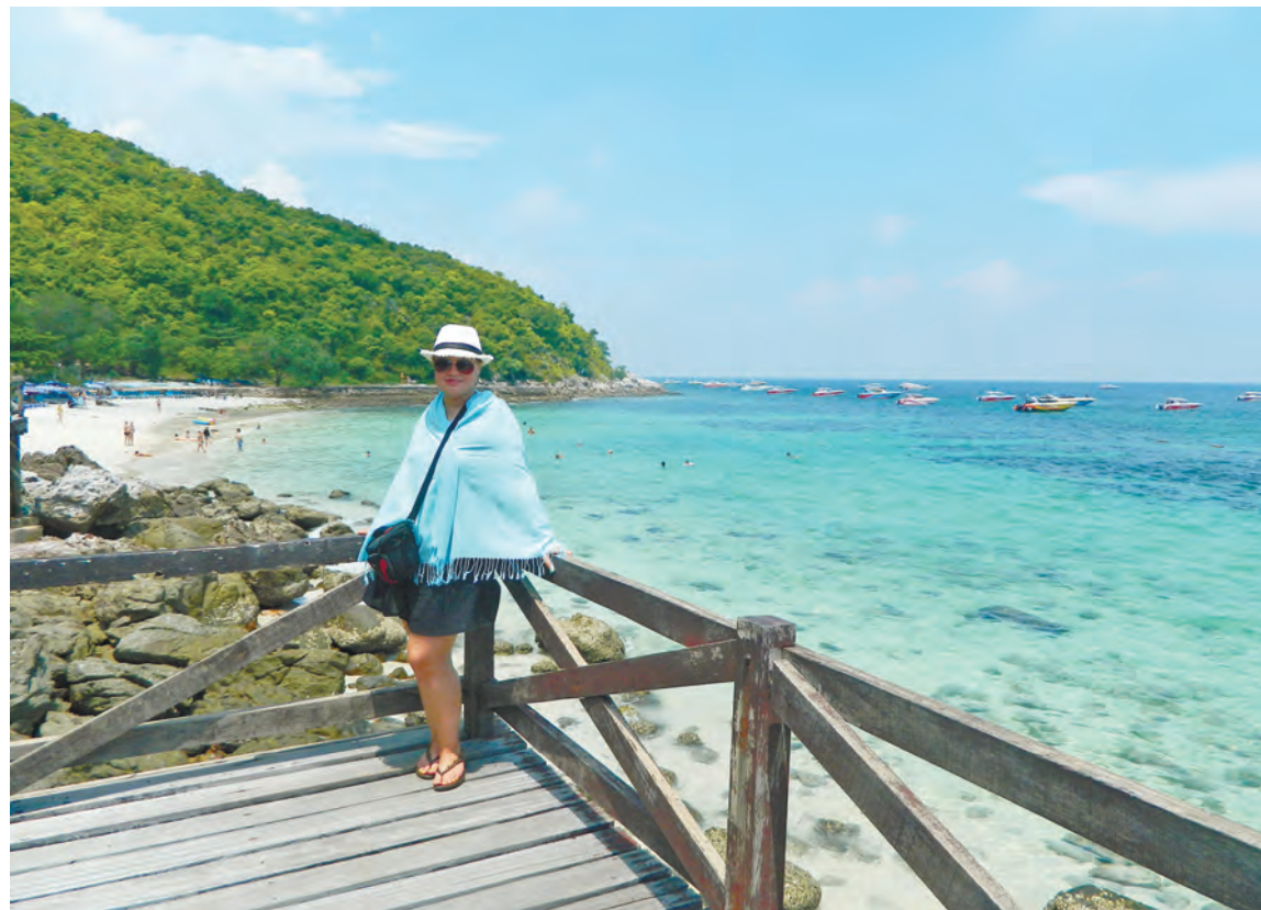
Поездка на острова. Пятнадцать минут на пароме, и вы оказываетесь в райском уголке. Остров можно выбрать любой.