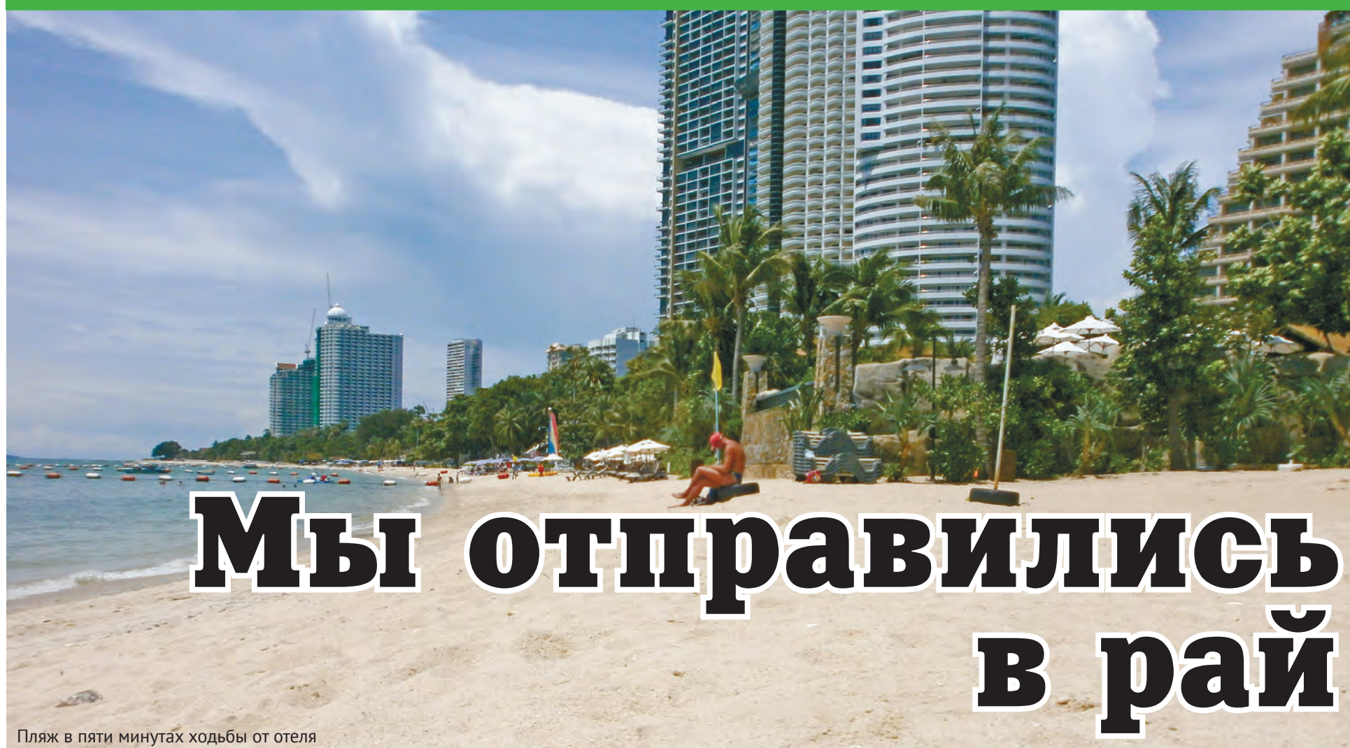
Пляж в пяти минутах ходьбы от отеля