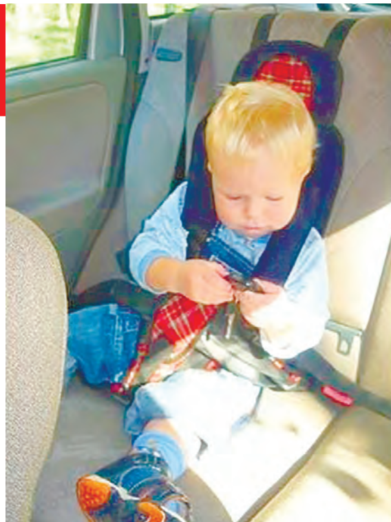
Вот так выглядит бескаркасное автокресло. Оно крепится к сиденью автомобиля, ребенок в нем пристегнут на четыре ремня, плюс через адаптер продевается и пристегивается ещё и ремень безопасности

К слову, по существу вопроса суды разбираться вообще не стали: является ли удерживающее универсальное устройство, соответствующее ГОСТу, росту и весу