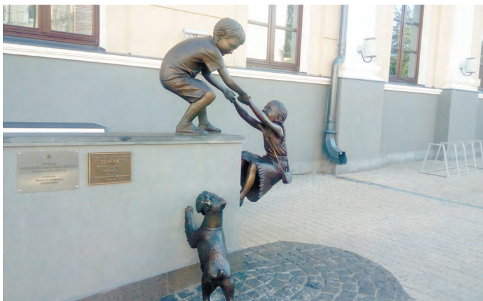
Скульптура «Доверие», подаренная городу стоматологической клиникой