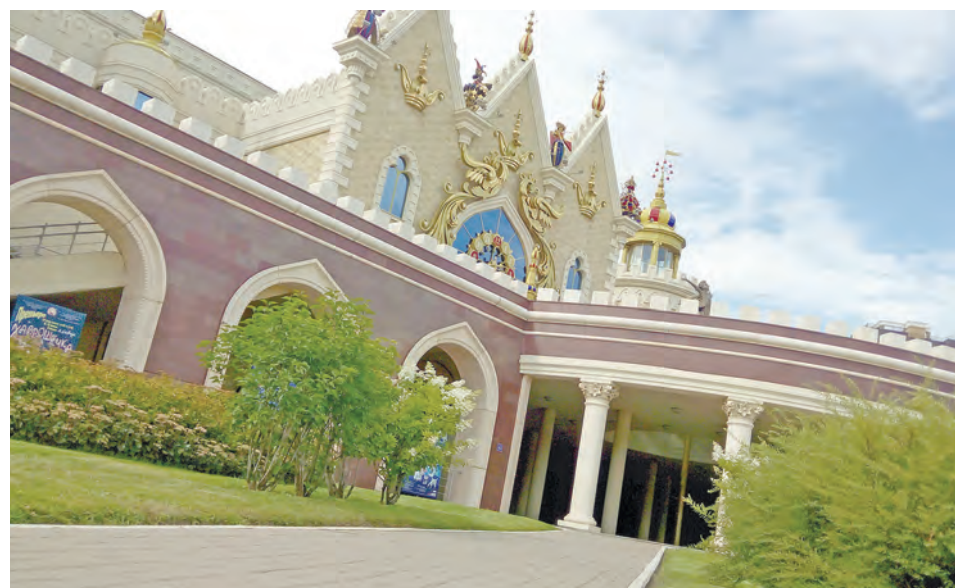
Кукольный театр в Казани