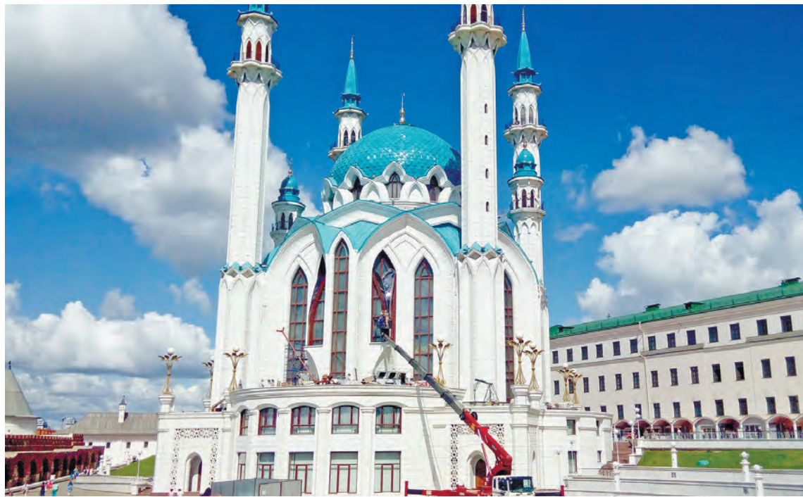
Мечеть Кул-Шариф — главная мечеть Татарстана

В 2008 году рядом с «Татнефть-Ареной» появился крупнейший в России гостинично-развлекательный комплекс «Ривьера» с огром-