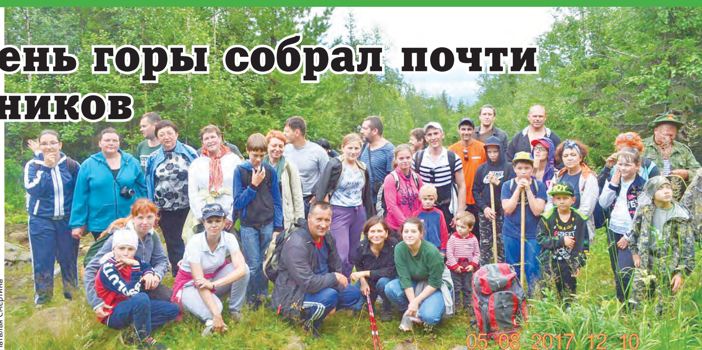
Участники восхождения получили массу незабываемых впечатлений