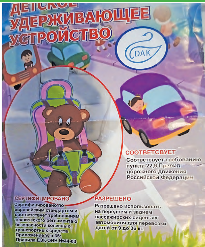
Инструкция к детскому удерживающему устройству ДАК