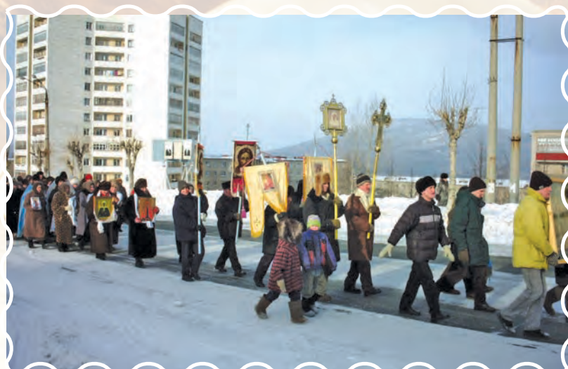
Крестный ход православных, 2003 год