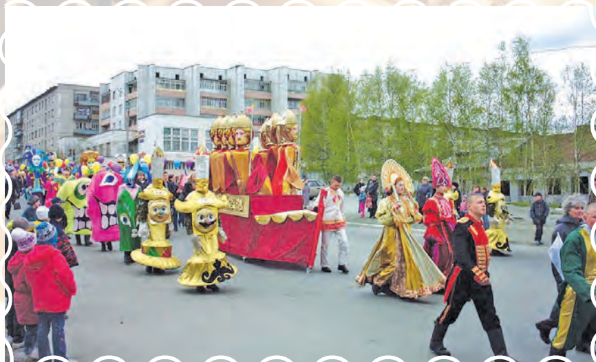
Маскарад по улице Свердлова, 2002 год