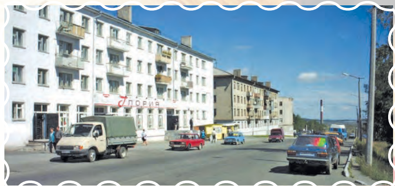
Магазин «Глория» сегодня стал «Восторгом», 2002 год