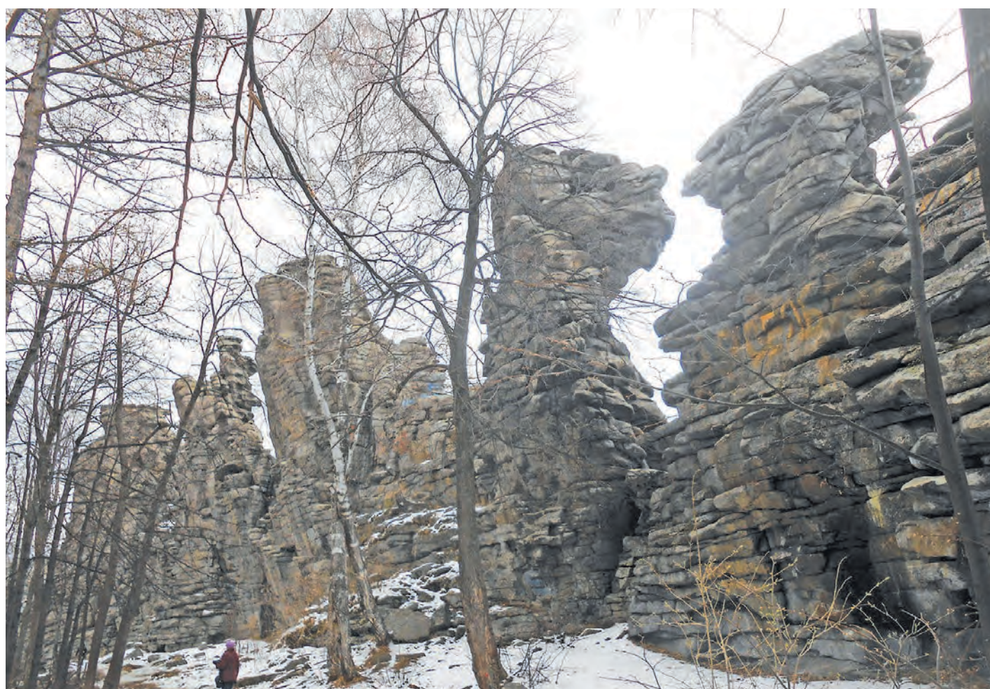
Скала «Семь братьев».