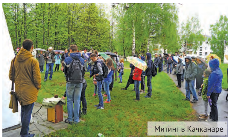
Митинг в Качканаре

В целом впечатления от митинга остались скорее по-