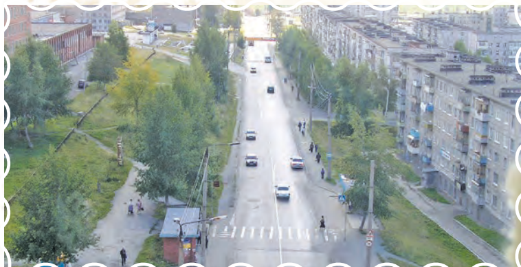
Улица Гикалова, 2004 год