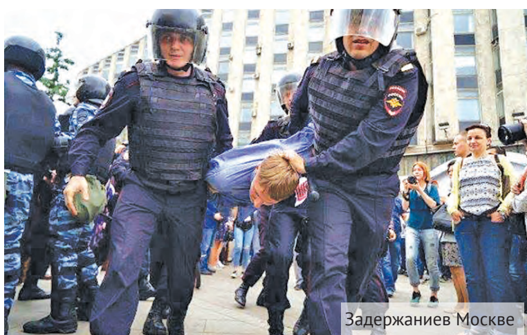
Задержание в Москве

ложительные. Пришло, конечно, не так много людей, как задумывалось, тут повлиял дождь. Наша ошибка, что мы не подготовили речей, и вообще в целом всё, что мы делали, было для нас в новинку: договориться о свете, найти по знакомым технику. Я за всю свою жизнь говорил что-то в микрофон первый раз. Огромная благодарность всем, кто на митинге выразил своё мнение. Народу в этот раз было значительно больше, это был митинг по-настоящему, люди приготовили плакаты, выступили перед толпой, поднимая важные для общества темы.