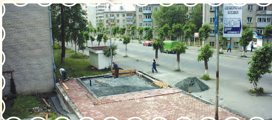
На площади строится новый торговый павильон, 2002 год