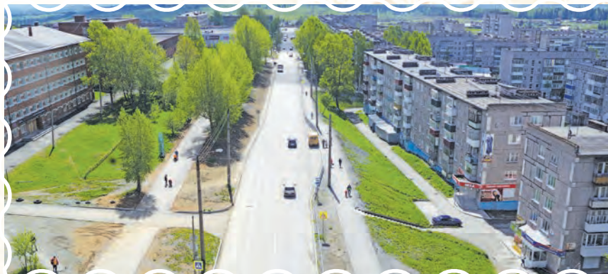
Так улица выглядит сегодня, 2017 год

В хронике использованы материалы книг «Качканар» (авт. Ю.П.Медведев), «Где урал пою» (ред. Ю.А.Горбунов), «Сердце на скале» (авт. Ф.Т.Селянин).