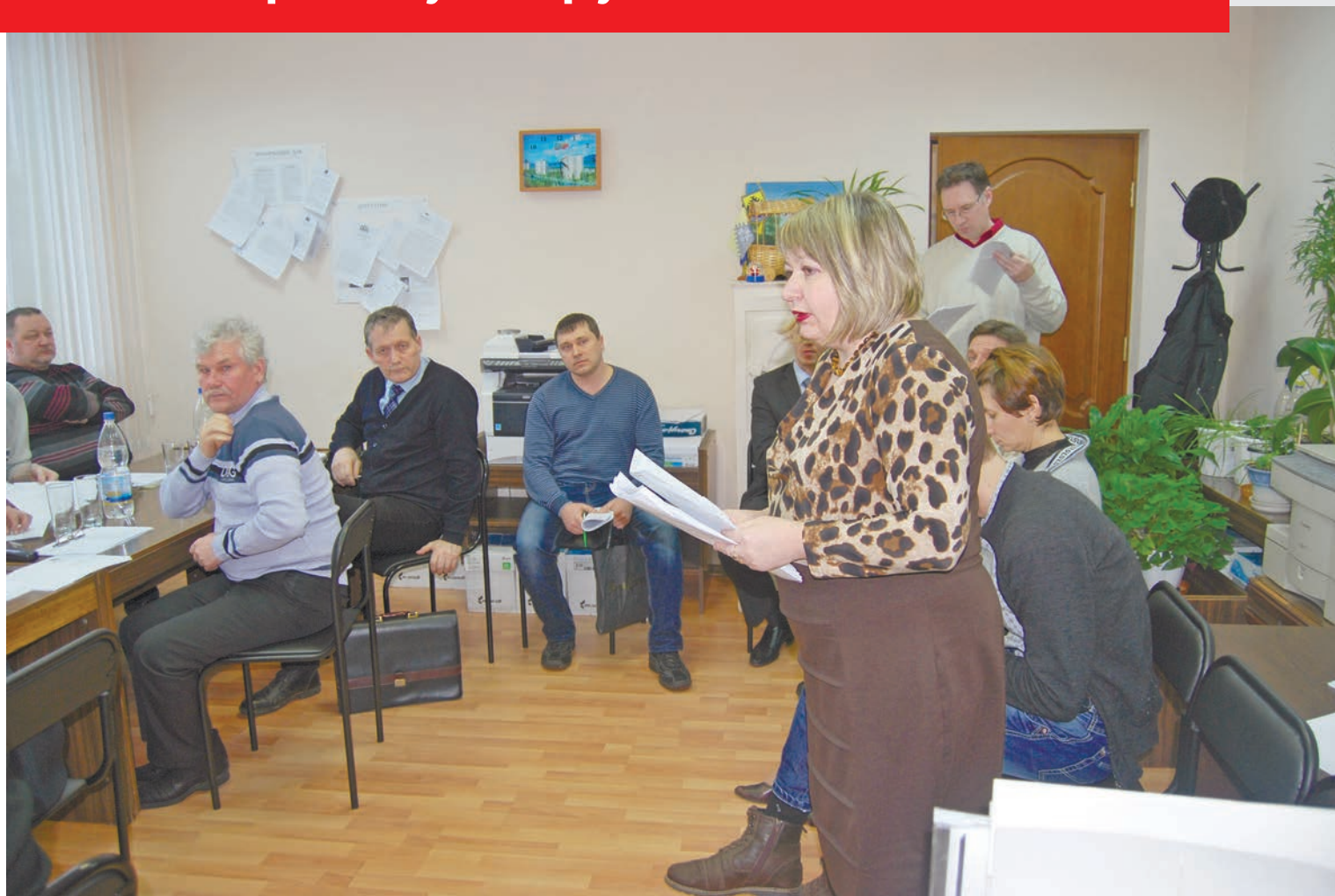
Родители воспитанников «Ритма» ищут деньги на соревнования в кабинетах чиновников

Почему при мэре-спортсмене спортшколы ходят с протянутой рукой?