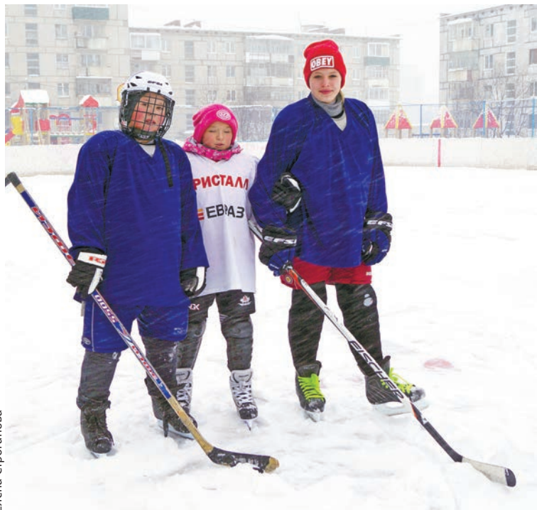
Девчонки гоняют шайбу наравне с парнями