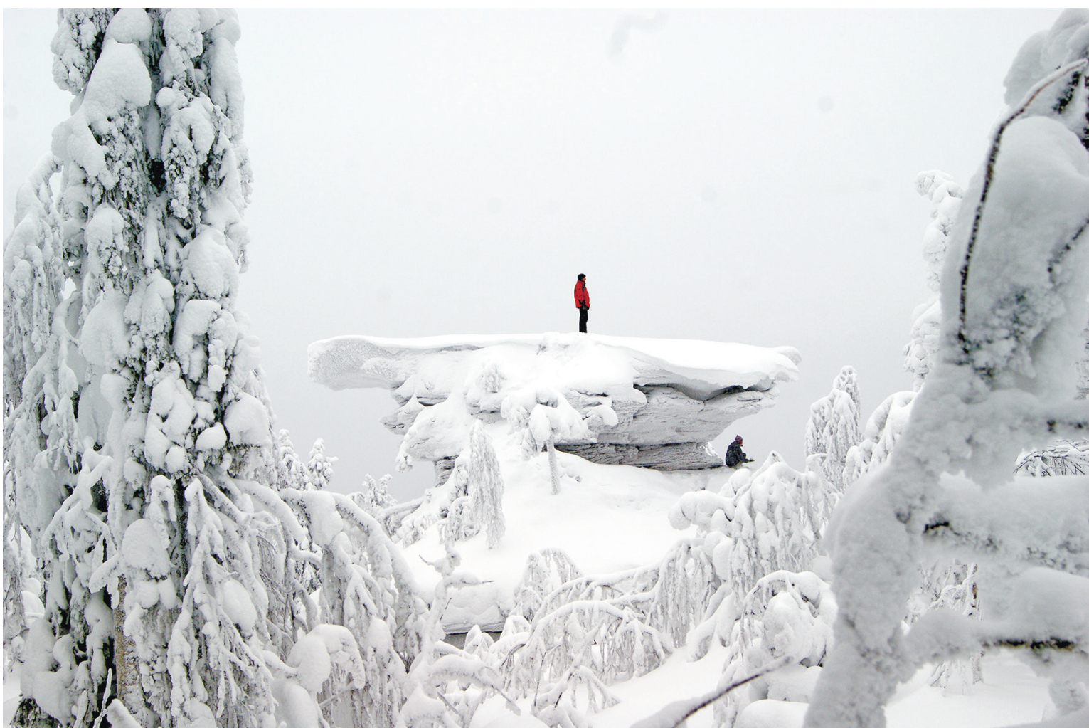
Почти на вершине мира