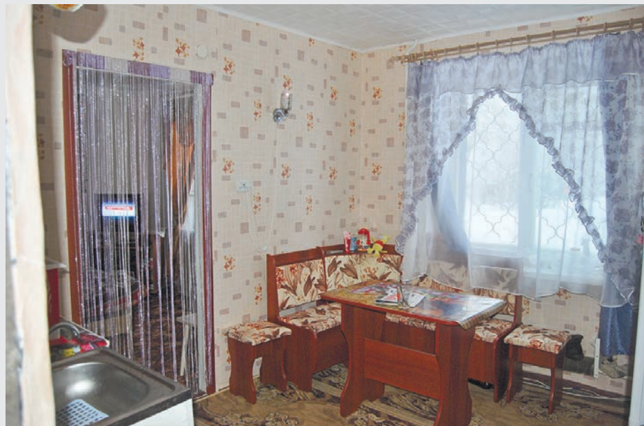
На контрасте: по сравнению с общим коридором (за содержание и ремонт которого жильцы платят по 360 рублей в месяц), комнаты выглядят просто идеально