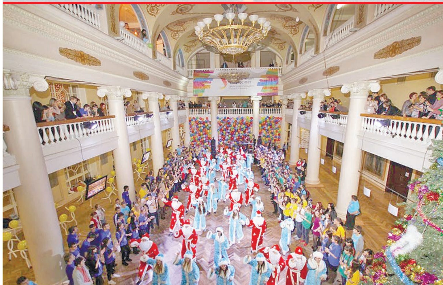
Флэшмоб Дедов Морозов стал грандиозным зрелищем

Будущие выпускники, не бойтесь участвовать в подобных проектах, это пойдёт вам на пользу!