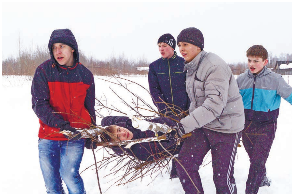
На пограничной заставе подростки учатся выживать в экстремальных условиях