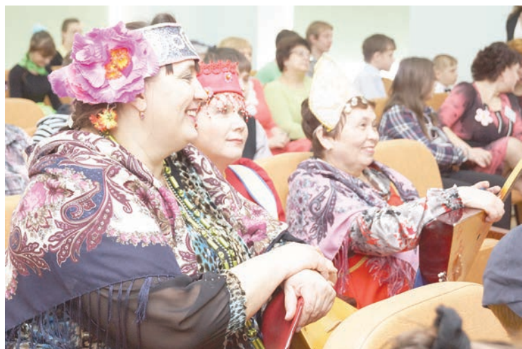
Воспитатели серовского детского дома