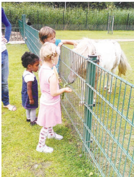
Мини-фермы пользуются в Голландии необыкновенной популярностью

Рождаемость здесь не высокая, многие пары совсем не хотят иметь детей: дорого, хлопотно, проблемы с работой, низкие пособия, проблемы с устройством в школу и детский сад, постоянный рост цен на медицинские страховки и другие знакомые нам всем проблемы. А также растущее число геев и лесбиянок, высокая смертность младенцев, что не удивительно, если детей рожают дома. Аборты разрешены до 24 недель. Но если не знать, как у нас в советское время заботилось государство о детях, когда сравнить не с чем, то вполне можно быть счастливым родителем и здесь.