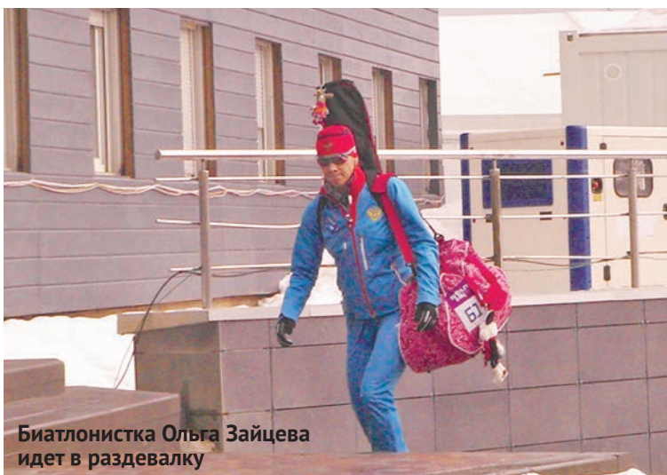
Биатлонистка Ольга Зайцева идет в раздевалку