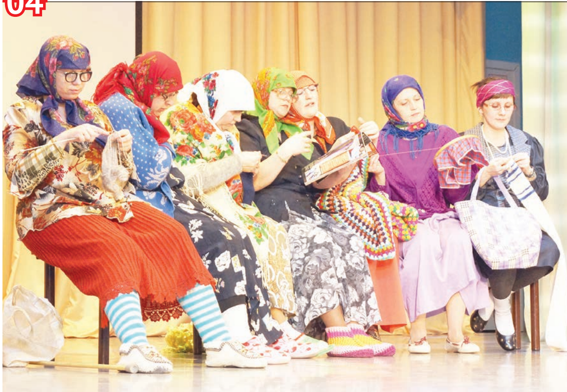
«Хитрые старушки» работают в детском саду «Ладушки»