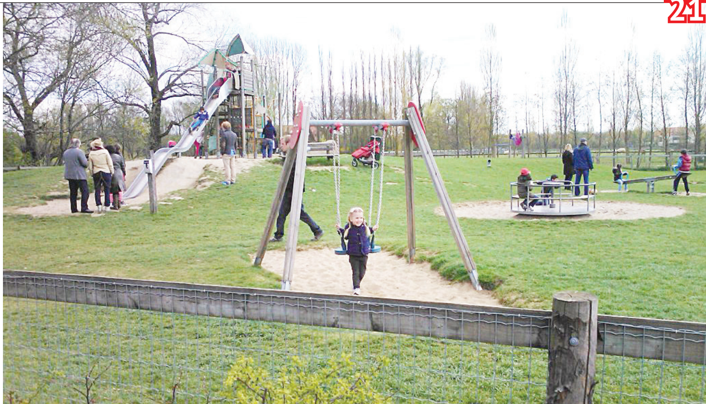
В основном, родители проводят всё свободное время с детьми

У мужа племянник всегда подрабатывал в магазине. Родители покупают необходимое, а хочешь дорогие кроссовки или гитару — покупай