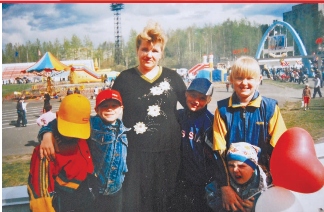
Все ребята для нее родные

– В былые времена я не припомню, чтобы в городе были детские дома, детишек, оставшихся без роди-